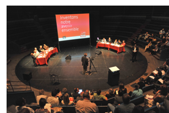
CD2R - Reims 2020