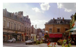
Commerces de proximité

© Une enquête est lancée auprès des entreprises et des communes pour recenser les besoins. Information sur l'ORAC Pays : http://www.sieprur.fr/pays_remois/contrat/index.php