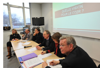
CD2R - Atelier de travail